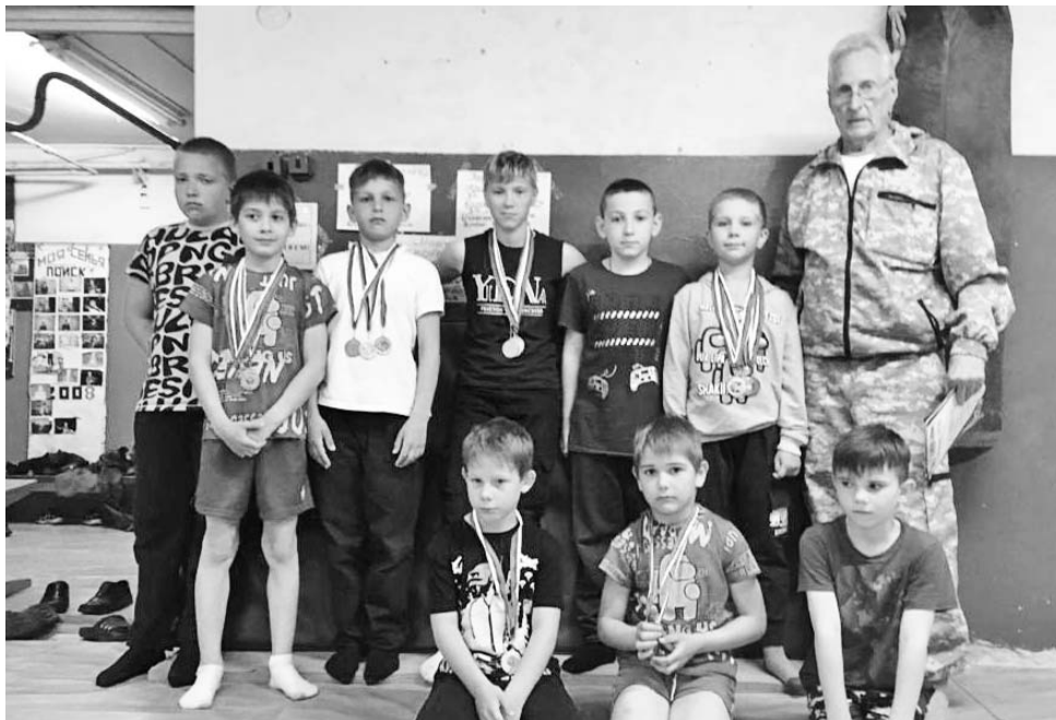
Каждый год самбисты клуба «Поиск» собираются помериться силой за очередной год тренировок.

В этот раз тренер выставил силовые упражнения из 6 тренажёров: скакалка, подтягивание на перекладине, отжимание от пола, упражнение на силу ног, упражнение с тренажёром на все группы мышц, работа на силу мышц груди и спины.